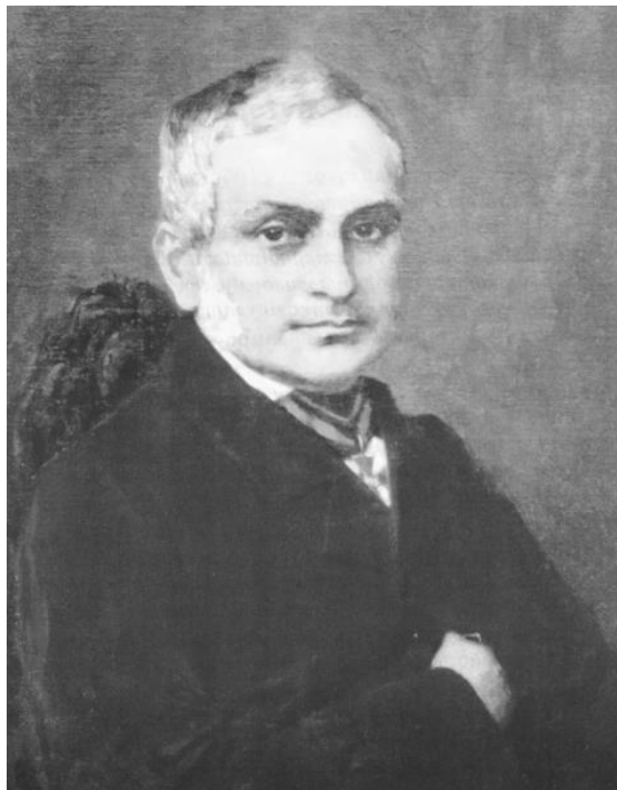
Аполлон Александрович Скальковський

В 1835 р. А. Скальковський здобуває дворянство, а двома роками потому його обрано на посаду секретаря Одеського відділення комерційної ради, яку вчений поєднував у 1841–1844 рр. з посадою чиновника з особливих доручень [2; 3; 29, с. 23–28].